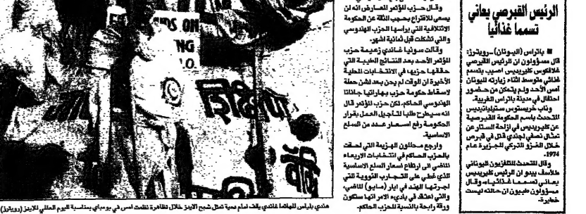
مندی بيرانس للصحافة العامة يفتتح ندوة في مدينة كابل، في باكستان، في 29 كانون الأول (ديسمبر) 1996

النيودلهي - 29 ديسمبر - يستعد الحزب الهندي الحاكم لفترة صعبة بعد الانتخابات. وقال مسؤولون: «سنواجه تحديات كبيرة، وسنحاول التغلب عليها».